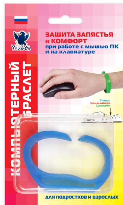
для подростков и взрослых