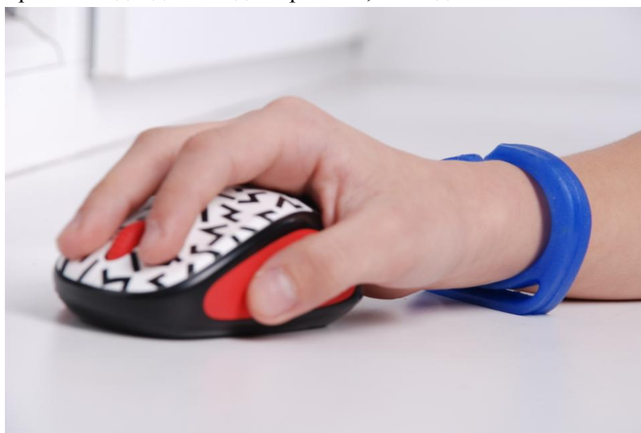
для правой и левой руки