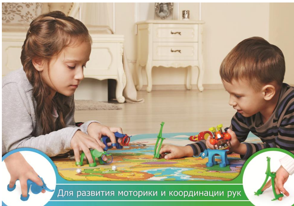
Для развития моторики и координации рук

Изготовлено из термопластичного эластомера производства Швеции. Ручная работа.