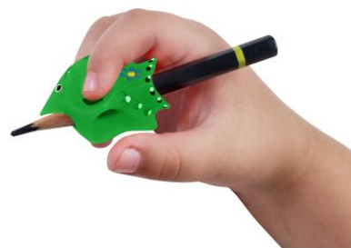
за дясна ръка