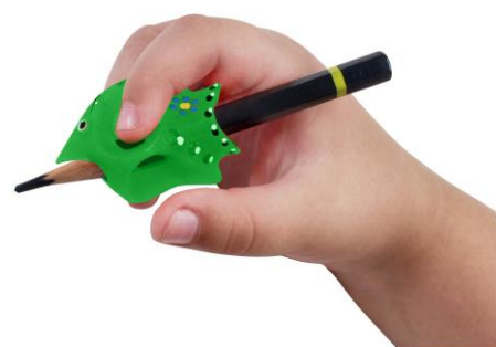
Le crayon malin pour droitiers