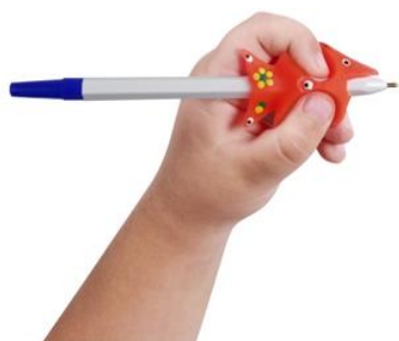
Le crayon malin pour gauchers

Recommandé pour les enfants à partir de 2 ans et demi et à partir de 6 ans pour le réapprentissage des droitiers.