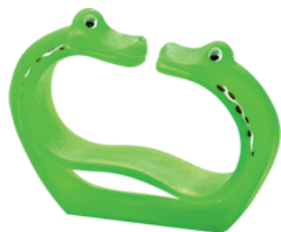
pour les enfants

Le bracelet-PC garantit un positionnement confortable du poignet lors de l'utilisation de la souris ou du clavier. Il est très compact et joli. Il soulage la tension au poignet, limitant ainsi le risque de blessures et il est effectif dans la prévention du syndrome du canal carpien.