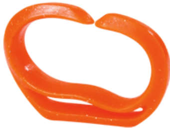
pour les adolescents et les adultes